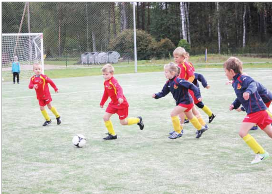
■ Pirmā futbola spēle rekonstruētajā Jaunolaines stadionā